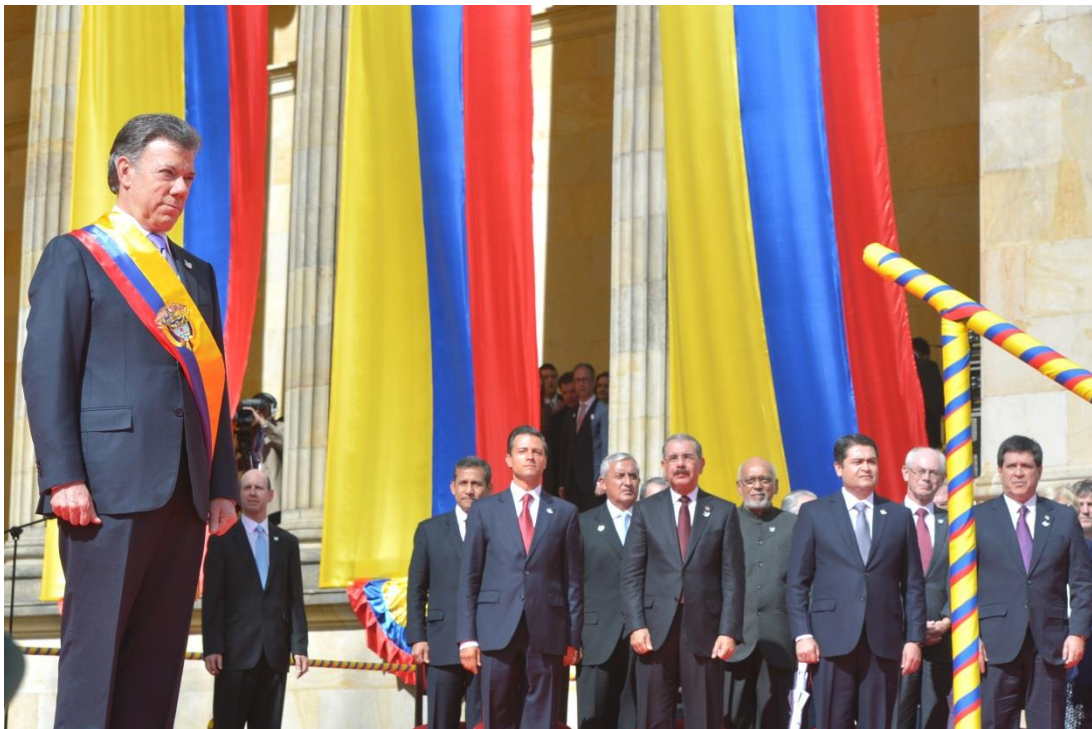
Mandatarios de distintos países del mundo asistieron a la posesión del segundo mandato del Presidente Juan Manuel Santos

“Hace cuatro años Colombia tenía dificultades que parecían insalvables con algunos vecinos. Hoy podemos decir, con satisfacción, que –así subsistan profundas diferencias en algunos aspectos– prevalece el respeto, prevalece la amistad y prevalece el deseo de cooperación que debe existir entre pueblos hermanos. Por supuesto, siempre protegiendo nuestros intereses y nuestra soberanía. Colombia ha recuperado un papel preeminente ante el mundo”.